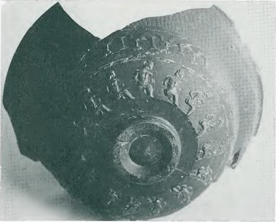
Vaso tardo italico decorato, Cimiez, No. inv. F66.1215.